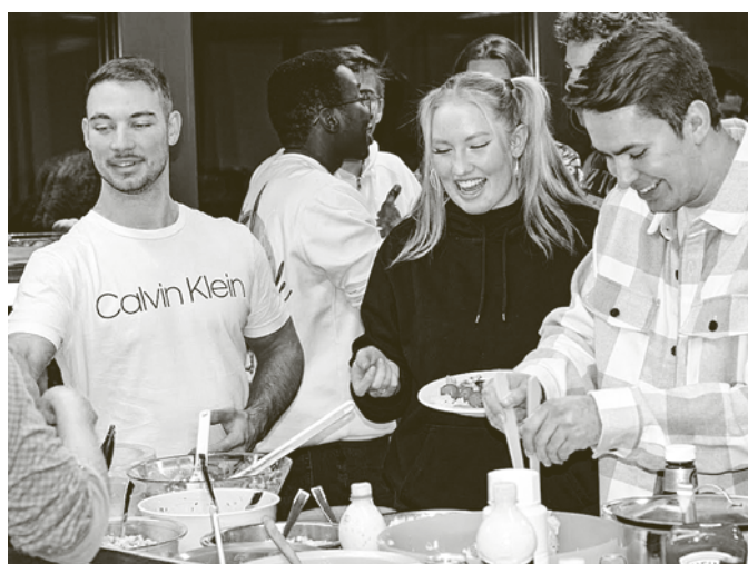
Eindrücke von der Jahresabschlussfeier