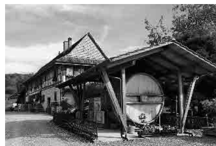
16 Ehem. Obere Mühle, 1835