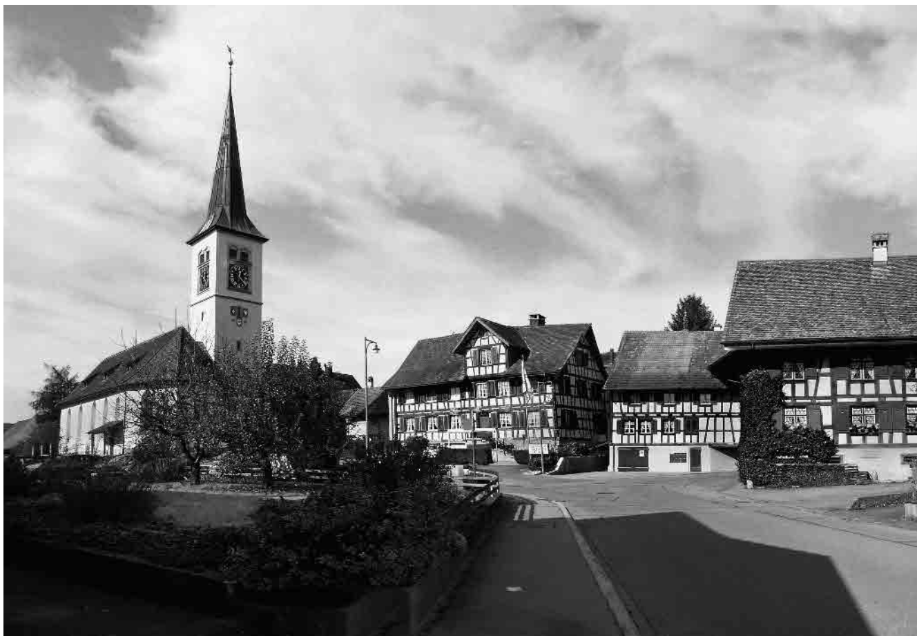
1 Oberdorf, ref. Pfarrkirche, 1585/18. Jh./1911