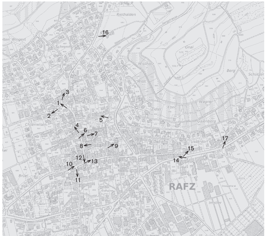
Plangrundlage: Übersichtsplan Kanton Zürich UP5, Reproduktionsbewilligung: Amt für Raumentwicklung Fotostandorte 1 : 10 000 Aufnahmen 2012: 1–17