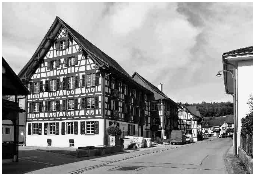
4 Gemeindehaus, 1811/12